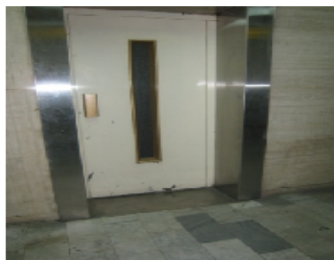
شکل ۴: آسانسور سالن عمومی با ابعاد نامناسب (۴)